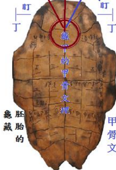
【虞國，包含夏.商.周三朝】