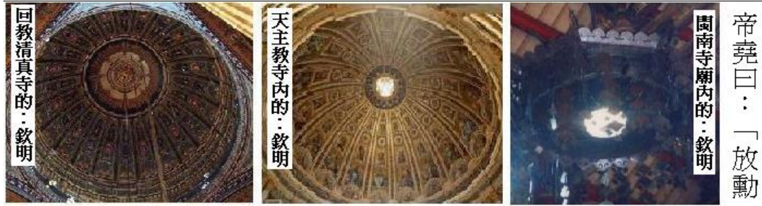
下圖↓（用閩南話讀）卦心的鏡台寫著：映落吟神龕，帝堯加著入孔窺